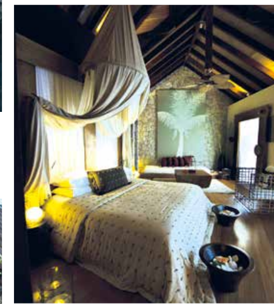
Villa de charme

● Le Domaine de l'Orangerie, Anse Sévère, La Digue – Seychelles Membre de Châteaux & Hôtels Collection + (248) 499 99 11 - reservations@orangerie.sc www.orangerie.sc