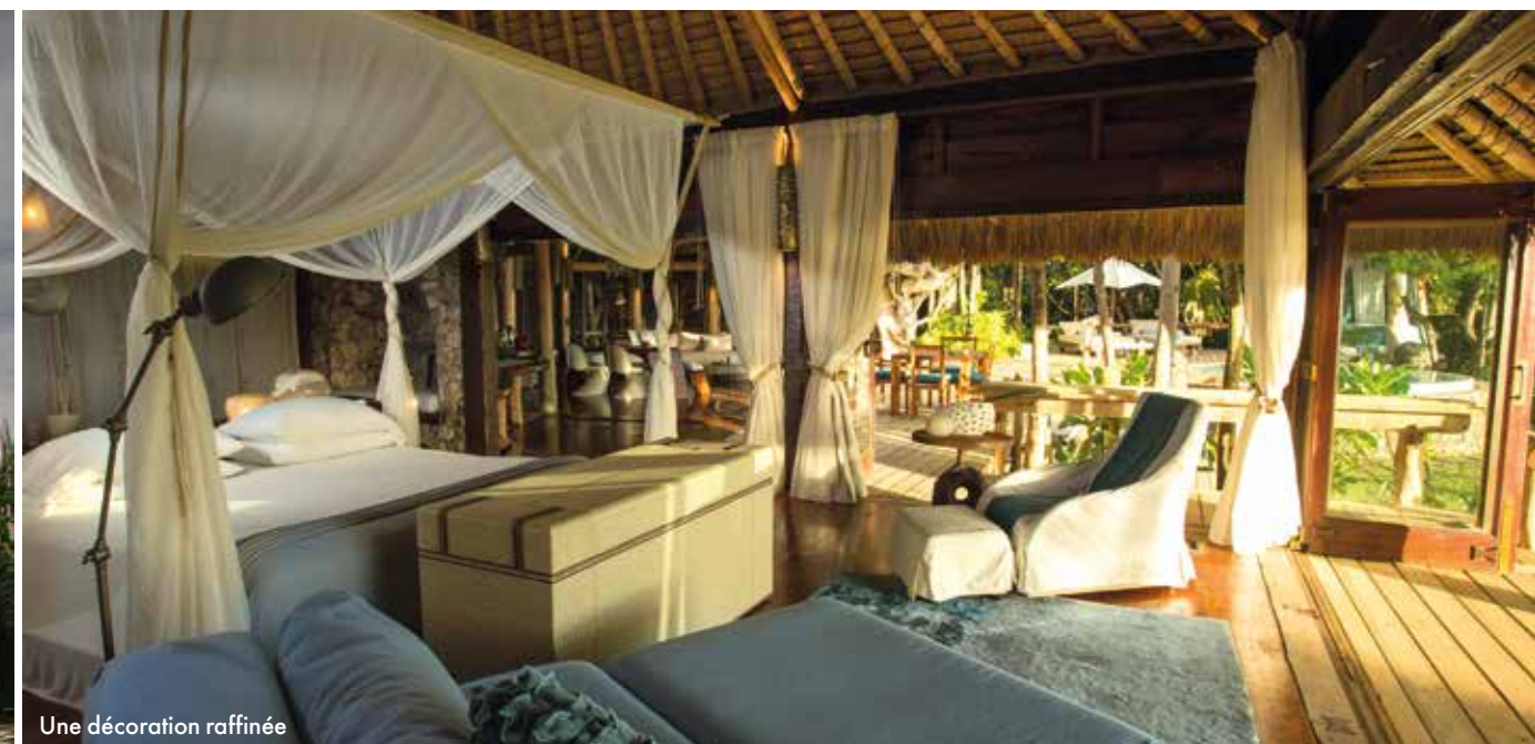
Une décoration raffinée