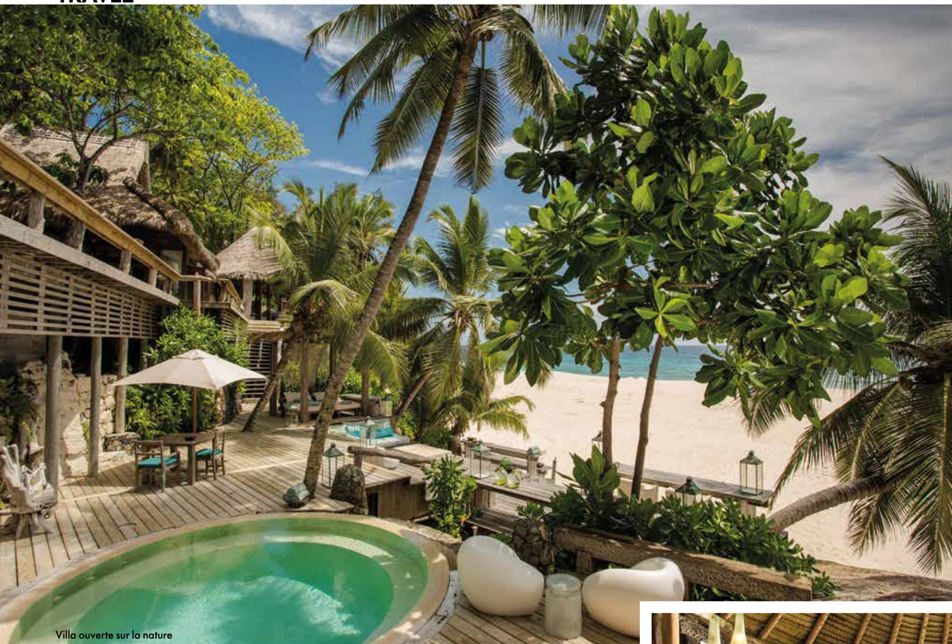
Villa ouverte sur la nature