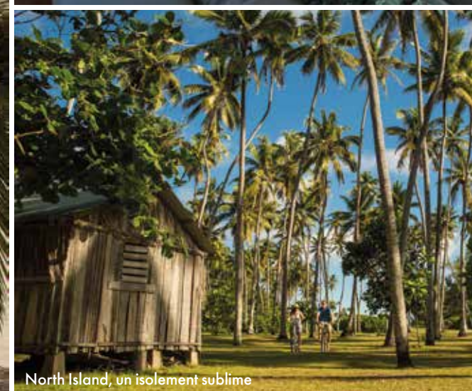
North Island, un isolement sublime