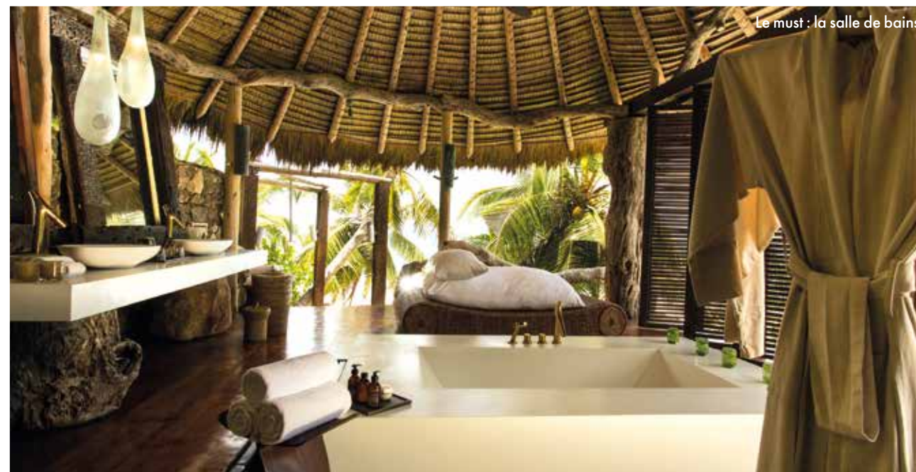
Le must : la salle de bains

Petite île sublime ancrée au large de Mahé, North Island joue la carte « fully inclusive » de la robinsonnade de luxe. Pour un contact privilégié avec la nature seychelloise. Quitte à rêver... autant le faire franchement ! North Island fait partie des plus beaux resorts du monde. Le luxe durable, dans les moindres détails. Parfaitement intégré dans les paysages de cette petite île des Seychelles, avec seulement 11 villas, North Island séduit dès le premier regard. Arrivé à bon port, on découvre le site. Authentique, préservé, forcément sublime. Ici, c'est l'option paradis pour tous, et surtout pour chacun : l'île est l'hôtel et chaque « chambre » est une villa évanouie entre le vert et le bleu. Bois flotté, fibres de coco, mobilier végétalisé, la nature fait le décor ! Avec son credo « no news, no shoes », c'est la tendance du moment, souvent copiée mais jamais égalée. D'innombrables coquillages et autres matériaux naturels ont été intégrés dans l'architecture et la décoration durable des résidences. Un way of life très exclusif, en totale symbiose avec son environnement. Loin, très loin, des tensions d'une planète en effervescence. ►